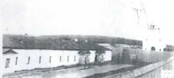
Кузнецкий тюремный замок. 1914 год.

С середины 1860-х годов все крепостные строения (кроме тюремного острога и госпиталя) перепроданы "в частные руки на слом купцу Ивановскому".